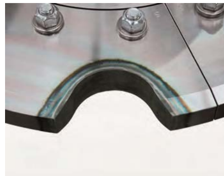
Рис. 2. Поверхностное упрочнение зоны контакта сегмента зубчатого колеса