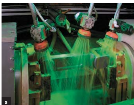
Рис. 3. Контроль качества продукции: а) магнитная дефектоскопия ковового звена, б) автоматическое тестирование твердости по Виккерсу