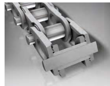
Рис. 5. Центральная цепь ковшового элеватора с кововыми звеньями и лабиринтным уплотнением

стали и высокой прочностью, равномерной по всему сечению изделия.