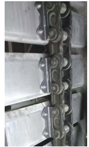
Рис. 9. Фрагмент элеватора цементной мельницы на заводе во Вьетнаме после замены центральной цепи и ковшей