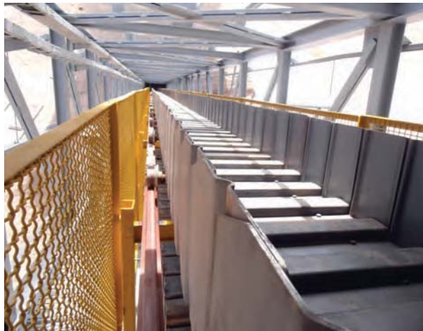
Рис. 8. Лотковый конвейер типа КСТ10/800–300 для транспортировки клинкера на заводе в Иране

вызванных усталостью, которые часто обна- руживали заказчики у центральных цепей ковшовых элеваторов обычной конструкции. Это является самым важным преимуществом данной разработки. В настоящее время но- винка еще не установлена ни на одном из ков- шовых элеваторов у кого-либо из заказчиков, так как научно-исследовательские и опытно- конструкторские работы завершились в кон- це 2016 года. Цепь полностью совместима с обычными центральными цепями компании НЕКО, а также с цепями других произведе- лей. Разработанные цепи с коваными звенья- ми обладают минимальным разрывным усили- ем 1250–1950 кН, что значительно выше, чем у центральных цепей, выпускаемых для ковшо- вых элеваторов другими компаниями.