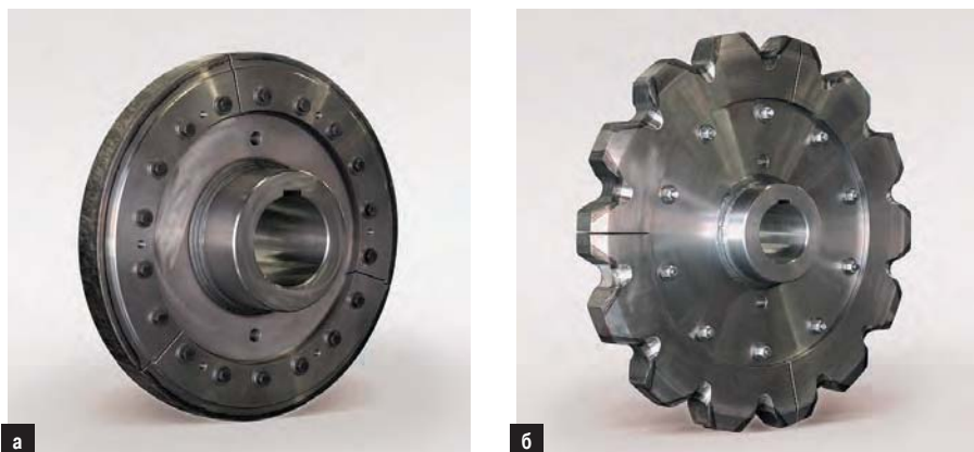
Рис. 6. Гладкое приводное (а) и натяжное зубчатое колесо (б) со сменным сегментным ободом

Одной из недавних разработок компании являются новые центральные цепи марки НЕКО для ковшовых элеваторов. Совершенно иная по сравнению с прежней конструкция цепей сводит к минимуму риск поломок,