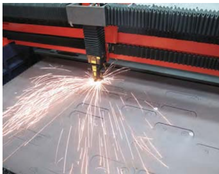
Рис. 1. Лазерная резка звеньев тяговой цепи ковшового элеватора

Закалка и отпуск звеньев цепи, валиков и роликов в инертной атмосфере способствуют формированию мелкозернистой структуры