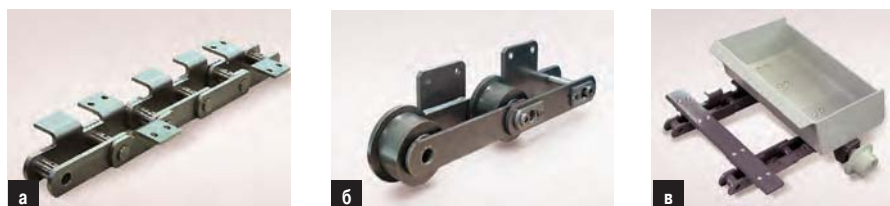
Рис. 7. Втулочная цепь с монтажными и поддерживающими уголками (а); с ребордным роликом и приварными монтажными пластинами (б); сегмент двухцепного лоткового конвейера с монтажной пластиной, лотком и роликами (в)