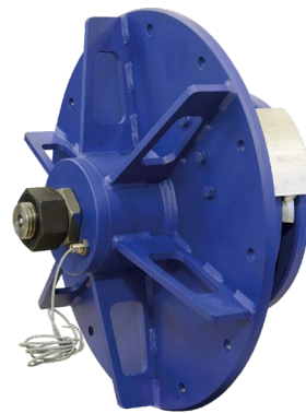
HEKO Stütz- und Einschnürrolle Typ UWE mit Anschraubflansch