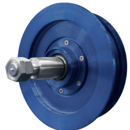
HEKO Stütz- und Einschnürrolle Typ UWE ohne Anschraubflansch

Weitere Abmessungen und Qualitäten auf Anfrage